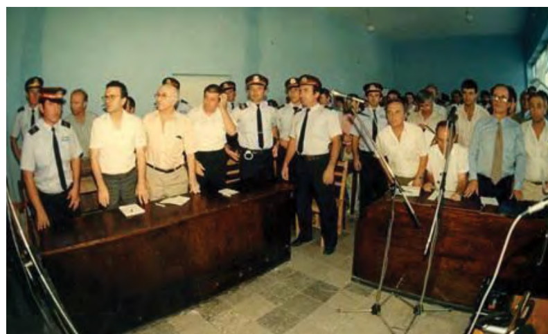
“Η δίκη των 5 τής Όμόνοιας”. Άπο τις πιό δύσκολες στιγμές του Βορειοηπειρωτικού Έλληνισμού.

Με τόν άποκλεισμό της άπο τις δεϋτερες κοινοβουλευτικές εκλογές με την έγκριση του νόμου μη άναγνώρισή της ως εκλογικό ύποκειμενο.