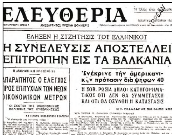
Πρωτοεῒλιδο τῆς ἐφημερίδος Ἐλευθερία τῆς 22ας Ὀκτωβρίου 1947.

(Ἀπόσπασμα ἀπὸ τὴ γ' ἐκδοσι τοῦ βιβλίου ὑπὸ τὸν τίτλο «Ὁ ἑλληνισμὸς τῆς βορείου Ἡπείρου μὲσα ἀπὸ ἄγνωστα ντοκουμέντα» τῶν ἐκδόσεων Πελασγός).