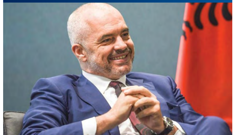
Πόσο εὐκρινῆς εἶναι ὁ Ἐντι Ράμα;