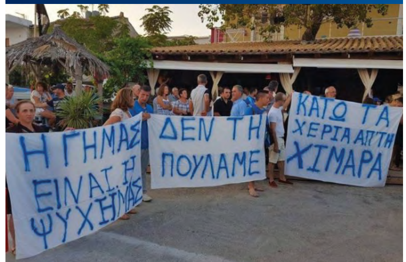
Τὸ κάστρο τῆς Χειμάρρας