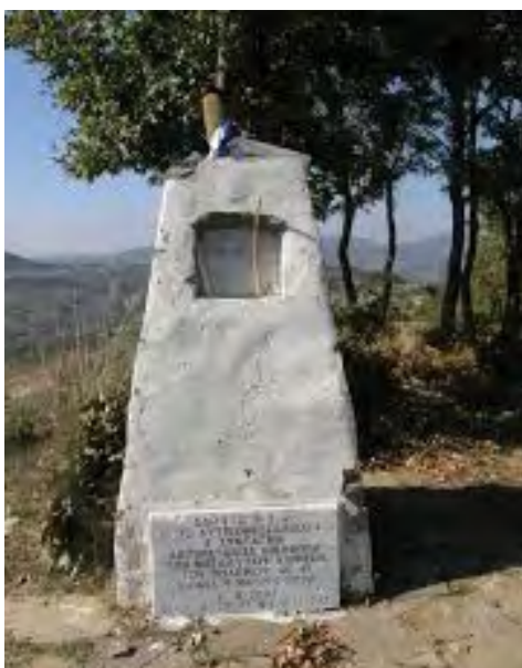
Τό λιτό μνημεῖο στά ἡρωικά χῶματα τῆς Βορείου Ἡπείρου, στό ὕψωμα 731.

σχυμένου Τάγματος Πεζικοῦ. Ἐκ τῆς ἰσχύος καί τῆς ἀντοχῆς μιᾶς χιλιάδος, ὡς ἔγγιστα, ἀνδρῶν ἐγκατεστημένων ἀμυντικῶς ἐπὶ τοῦ ὕψώματος, ἐκρίνετο ἡ ἔκβασις τῆς ἐπιχειρηθείσης κατὰ Μάρτιον 1941 διασπάσεως τῆς