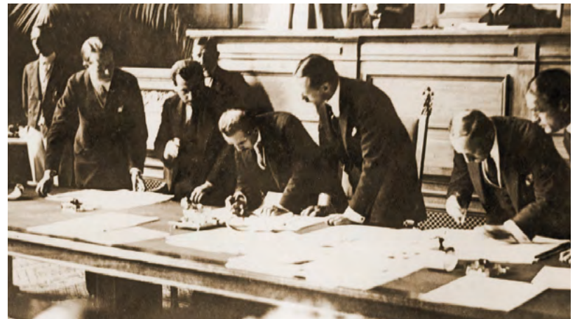
Ἡ Συνθήκη τῆς Λωζάννης καὶ οἱ Τσάμηδες- Μία χαμένη διπλωματικὴ εὐκαιρία γιὰ τὴν Ἑλλάδα

Μακάρι, ἡ πρωθυπουργικὴ ἐπίσκεψη στὴν Βόρειο Ἡπειρο, νὰ ἀποδώσῃ τοὺς καρπούς πού ἀναμένουν, χρόνια τώρα, οἱ ἀδελφοί μας Βορειοηπειρώτες.