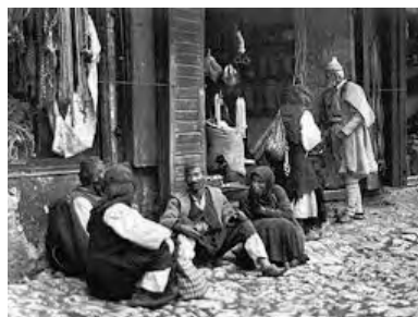
«Τσάμηδες» στή Θεσπρωτία

Ἡ καθηγήτρια Ἱστορίας στήν Νομική Σχολή Ἀθηνῶν κ. Λένα Διβάνη, στό βιβλίο της «Ἑλλά-