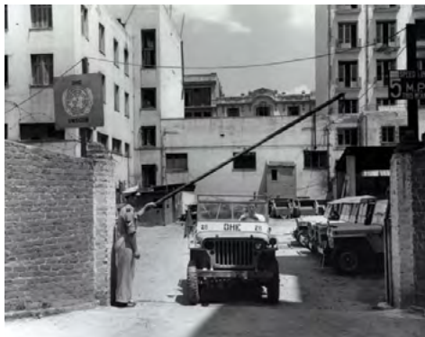
ἓνα τζιπ τῆς United Nations Special Committee on the Balkans (UNSCOB) περνάει τὴν πύλη τοῦ στρατοπέδου, ὅπου αὐτὴ ἔδρευε στὴ Θεσσαλονίκη.

Τ ὸν Δεκέμβριο τοῦ 1946, ἡ κυβέρνηση Τσαλδάρη προσέφυγε στὰ Ἴνωμένα Ἔθνη, καταγγέλλοντας τὴν πολιτικὴ τῶν ἐπεμβάσεων τῶν γειτονικῶν κρατῶν (συμπεριλαμβανομένης τῆς Ἀλβανίας) στὰ ἑσωτερικά της. Αυτό συνέβαινε μέσω τῆς φανερῆς πλέον συνδρομῆς τους πρὸς τὸν Δημοκρατικὸ Στρατὸ Ἑλλάδας (Δ.Σ.Ε.). Συνεστήθη μία διεθνῆς ἐπιτροπὴ, μὲ τὴν συμμετοχὴ καὶ ἐκπροσώπων τῶν σοσιαλιστικῶν κρατῶν. Οἱ Δυτικοὶ προσεπάθησαν νὰ ἰσοσκελίσουν τὴν προαναφερθεῖσα ὑποχώρησή τους στὸ συμβούλιο τῶν ὑπουργῶν Ἐξωτερικῶν ἀφ' ἑνὸς προσφέροντας τὴν συμπαράστασή τους στὸν Ο.Η.Ε. καὶ ἀφ' ἑτέρου συνδράμοντας ἐνεργὰ τὴν ἑλληνικὴ κυβέρνηση στὸν ἀγῶνα της γιὰ τὴν συντριβὴ τοῦ «Δημοκρατικοῦ Στρατοῦ» καὶ τὴν ἐπιβολὴ τῆς τάξεως σὲ ὅλη τὴν ἐπικράτεια τῆς χώρας. Ἐκτοτε, ὅμως, παγιώθηκε ἡ κατάστασις στὴν