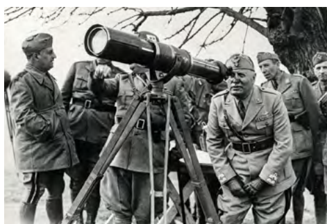
9.3.1941 Ο Μουσολίνι παρακολουθεῖ καί καθοδηγεῖ τήν ἐπιθεση.

Σήμερα στό Μνημεῖο τοῦ Ἀγνώστου Στρατιώτου στήν Ἀθήνα ὑπάρχουν χαραγμένα δύο ὀνόματα, τό 731 καί τό Μπούμπεσι, γιά νά θυμίζουσαν τό ἔπος τῶν ἡμερῶν ἐκείνων. Στό σημεῖο τῶν μαχῶν στόν χῶρο τῆς Βορείου Ἡπείρου ὑπάρχει ἕνα λιτό καί ἀπέριπτο μνημεῖο πού συγκεντρώνει κάθε χρόνο